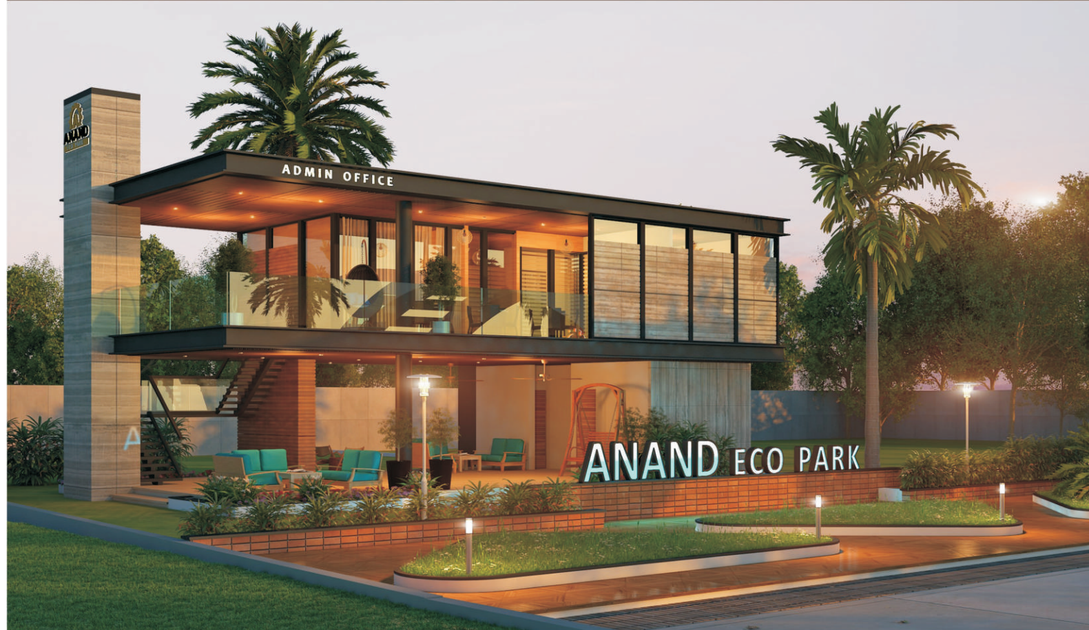
Morden designed admin center