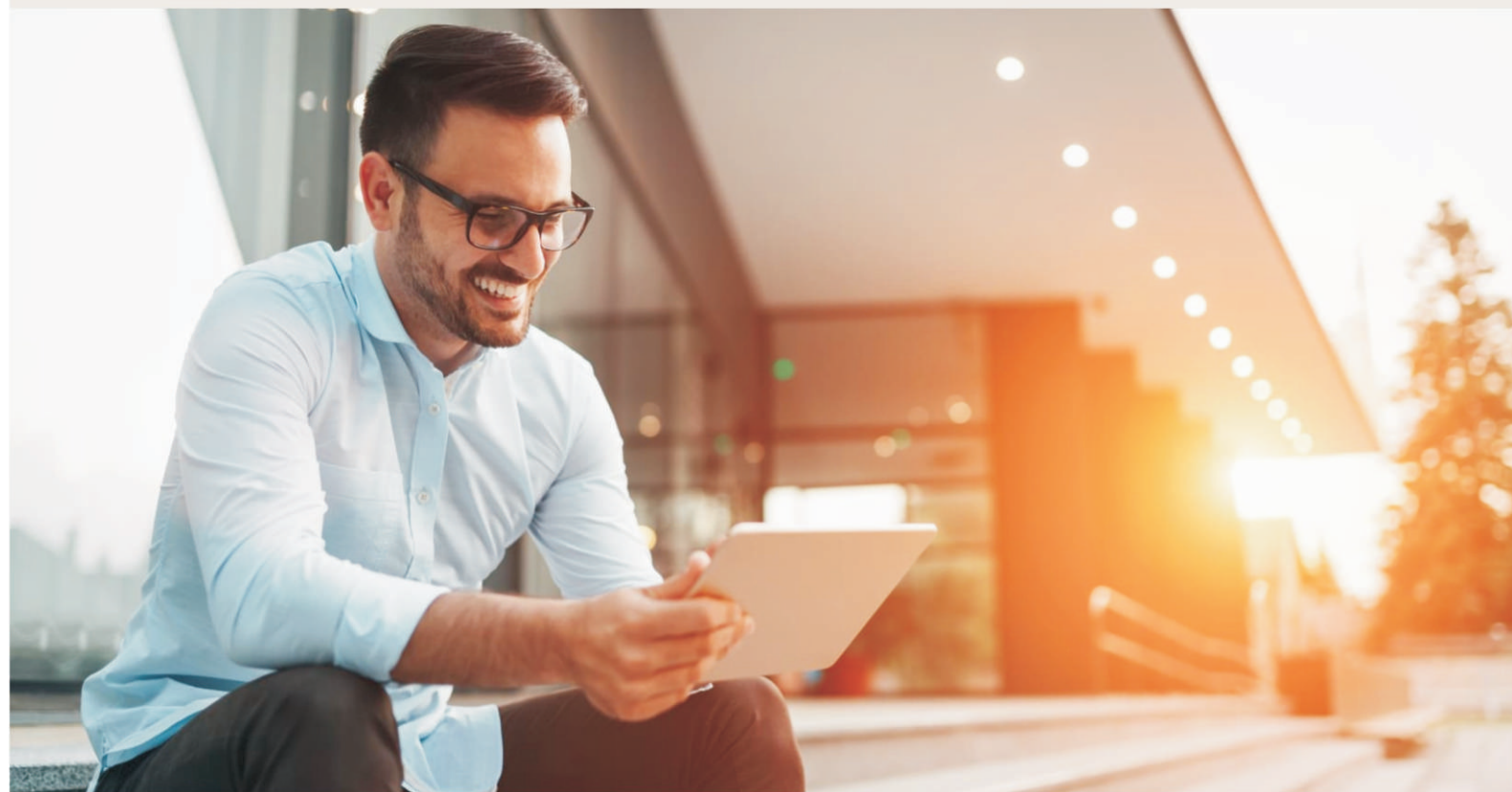
GROW YOUR BUSINESS....